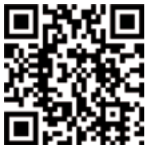
Anwendungsbeispiel Lamello Invis ®